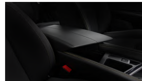
Elegancki i praktyczny podłokietnik ze schowkiem