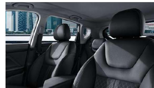
Miękkie tworzywa we wnętrzu