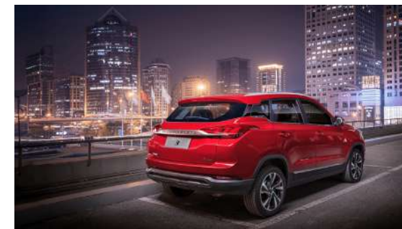
Czujniki parkowania i kamera cofania z dynamicznymi liniami pomocniczymi.