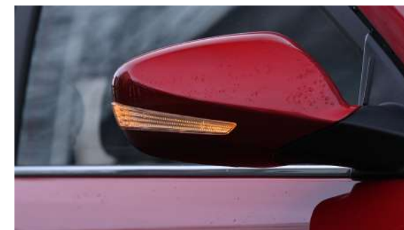
Lusterka zewnętrzne z kierunkowskazami