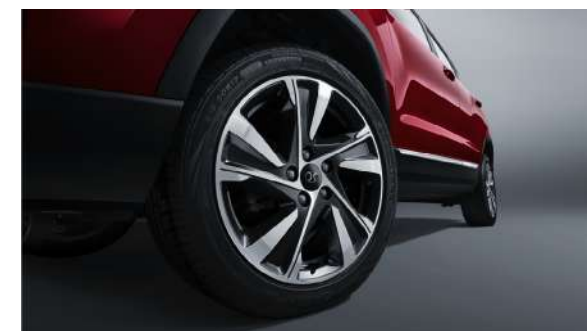
16-calowe dwukolorowe felgi aluminiowe