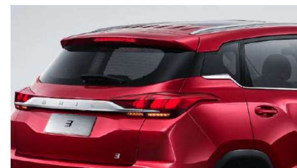
Standardowe srebrne relingi dachowe