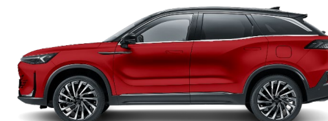
Czerwony metalizowany + czarny dach (lakier bezpłatny) 72R2