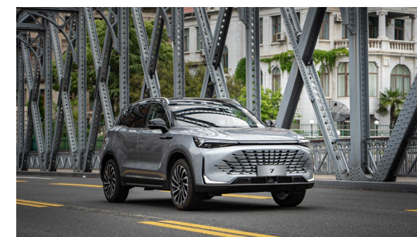
Tryby jazdy (Standard / Sport / Eco)