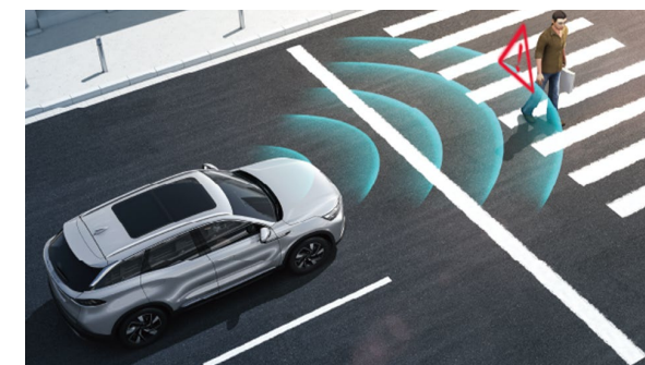
System automatycznego hamowania awaryjnego AEB (identyfikacja pojazdów i pieszych)