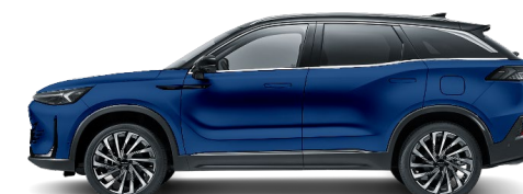
Niebieski metalizowany + czarny dach 72B1