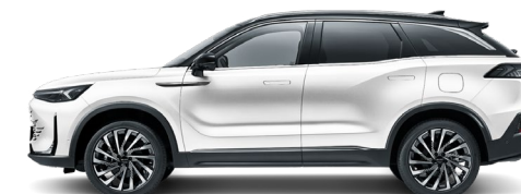
Perłowy biały + czarny dach/ 72W1