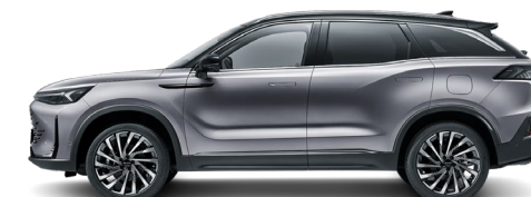
Ciemnoszary metalizowany + czarny dach 72G1