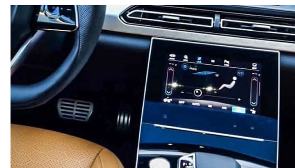
Dotykowy 7-calowy ekran do sterowania klimatyzacją