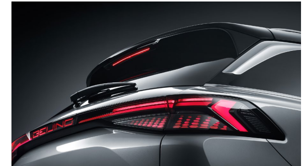
Elektrycznie unoszona i opuszczana kłapa bagażnika