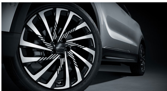
19-calowe dwukolorowe felgi aluminiowe