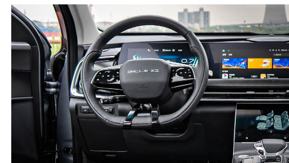
Regulowana siła wspomagania kierownicy