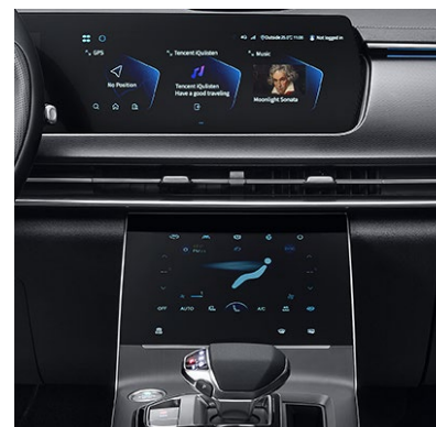
Układ kontroli jakości powietrza AQS