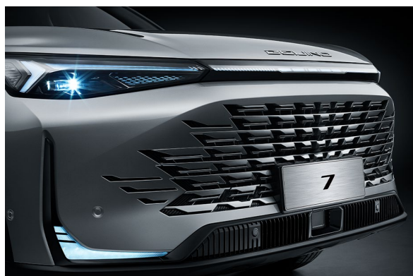
Inteligentne sterowanie reflektorami HMA