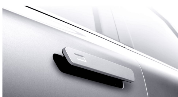
Chowane klamki w powierzchni drzwi