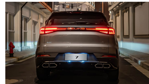
System sygnalizacji awaryjnego hamowania