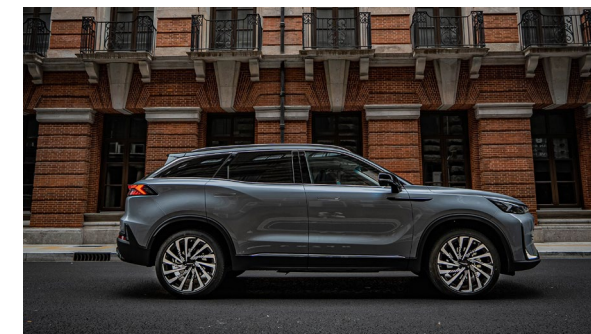
Inteligentny tempomat adaptacyjny IACC