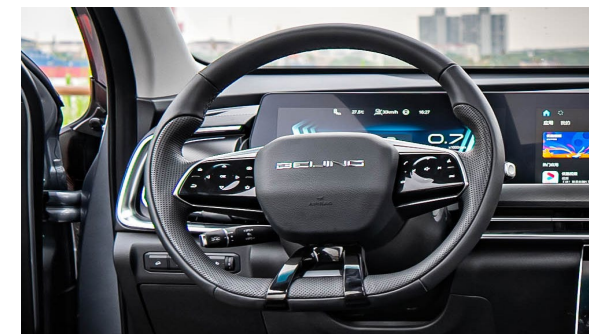
Kierownica wielofunkcyjna z panelami dotykowymi