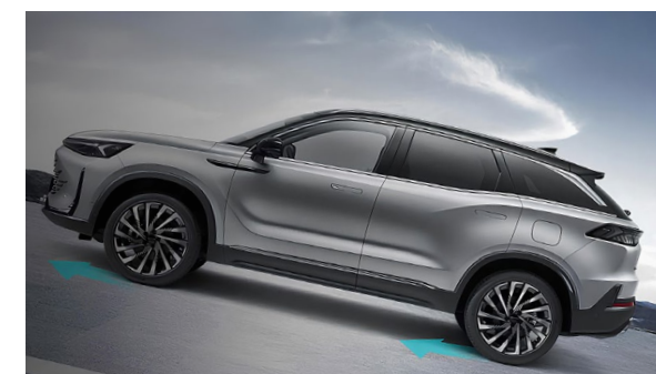
Wspomaganie ruszania na wzniesieniu Hill Control