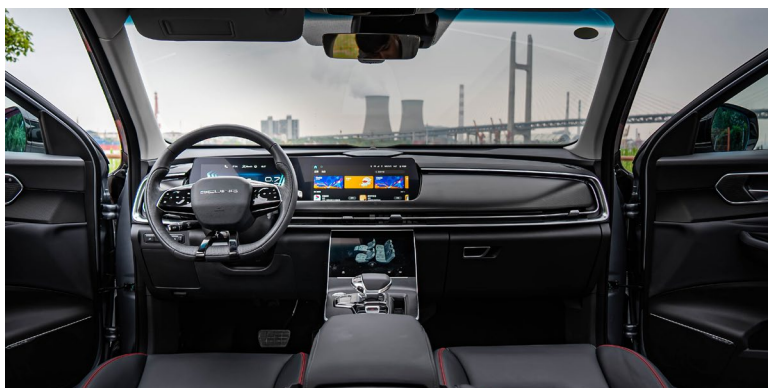
Wnętrze wyściełane miękkim materiałem o bionicznej strukturze