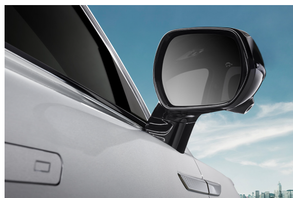
Czujnik martwego pola BSD