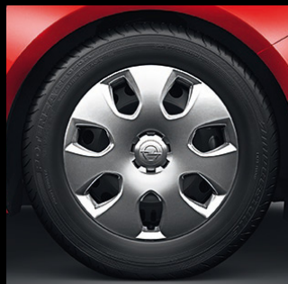
Felgi stalowe z kołpakami 17 x 7", opony 235/55 R 17 (PWP 1 ). Standard w wersji Enjoy.