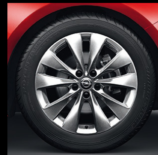
Felgi aluminiowe 18 x 7,5", wieloramienne, opony 235/50 R 18 (RQJ 2 ). Standard w wersji Sport.