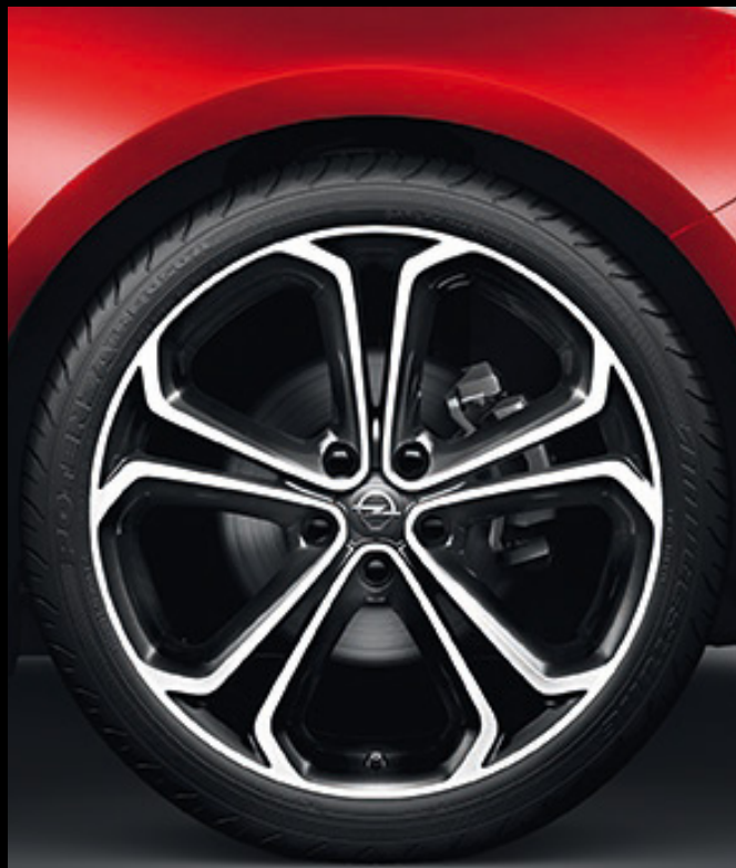
Felgi aluminiowe 20 x 8,5", 5-ramienne, opony 245/40 R20 (RQA).

Astra GTC, o płynnych liniach nadwozia i zarazem masywnej sylwetce, rodzi przyjemne uczucie posiadania. Atrakcyjność samochodu można zwiększyć, wybierając jedną z oferowanych felg aluminiowych.