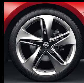
Felgi aluminiowe 20 x 8,5", 5-ramienne, opony 245/40 R20 (RQ9).