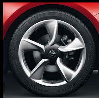
Felgi aluminiowe 19 x 8", 5-ramienne, opony 235/45 R 19 (RT8).