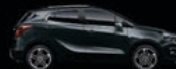
Szary Quantum 1