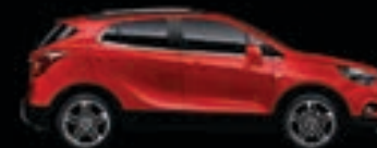
Czerwony Absolute 1