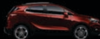
Bordowy Rouge Brown 1,2