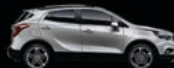
Srebrny Sovereign 1