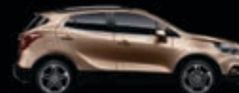
Beżowy Silky 1