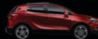
Czerwony Velvet 3