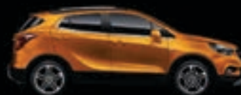
Pomarańczowy Amber 1

Skonfiguruj swoją Mokkę X na www.opel.pl/mokka-x