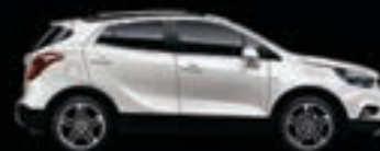
Biały Abalone 1