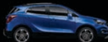
Niebieski Boracay 1,3