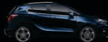
Niebieski Darkmoon 1,2