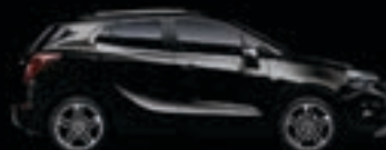
Czarny Mineral 1