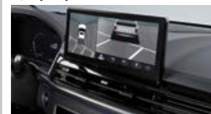
System kamer 360 stopni