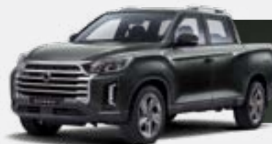
AMAZONIA GREEN (GAM)