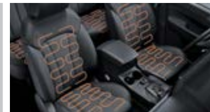
Siedzenia przednie i tylne podgrzewane