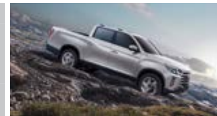
HDC – system kontroli zjazdu ze wzniesienia