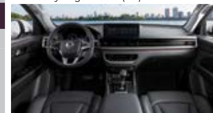
Nowe wnętrze z 12,3 calowym wyświetlaczem Android Auto / Apple CarPlay