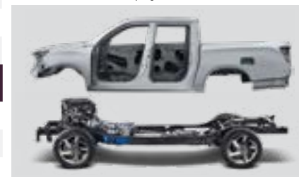
Nadwozie i rama ze stali o bardzo wysokiej wytrzymałości na rozciąganie