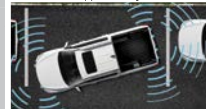
Czujniki parkowania przednie i tylne