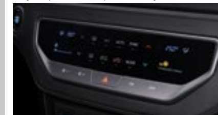
Automatyczna klimatyzacja dwustrefowa