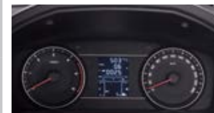
Zestaw wskaźników z 3,5" komp. pokładowym