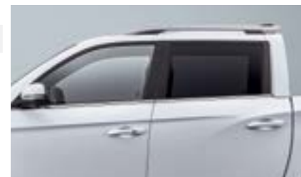
Przyciemniane tylne szyby