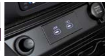
Gniazda USB typu C