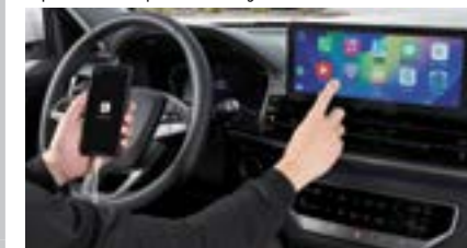
Android Auto / Apple CarPlay