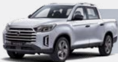
SILKY WHITE PEARL (WAK)