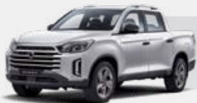
GRAND WHITE (WAA)