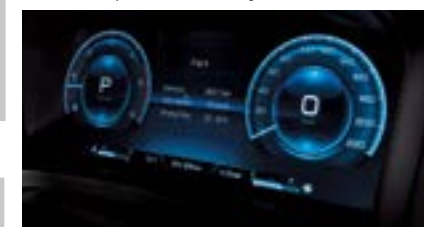
12,3 " cyfrowy zestaw wskaźników