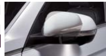
Oświetlenie okolic pojazdu w lusterkach