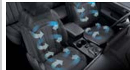
Siedzenia przednie wentylowane