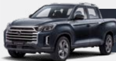
GALAXIES GREY (ADB)