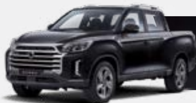
SPACE BLACK (LAK)