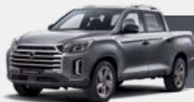
MARBLE GREY (ACM)