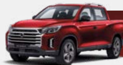
INDIAN RED (RAJ)