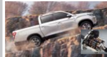
Blokada tylnego mostu (LD)