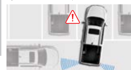
RCTA System monitorowania ruchu za pojazdem z asystentem