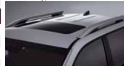
Relingi dachowe i szyberdach