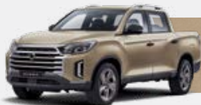
SANDSTONE BEIGE (EBK)