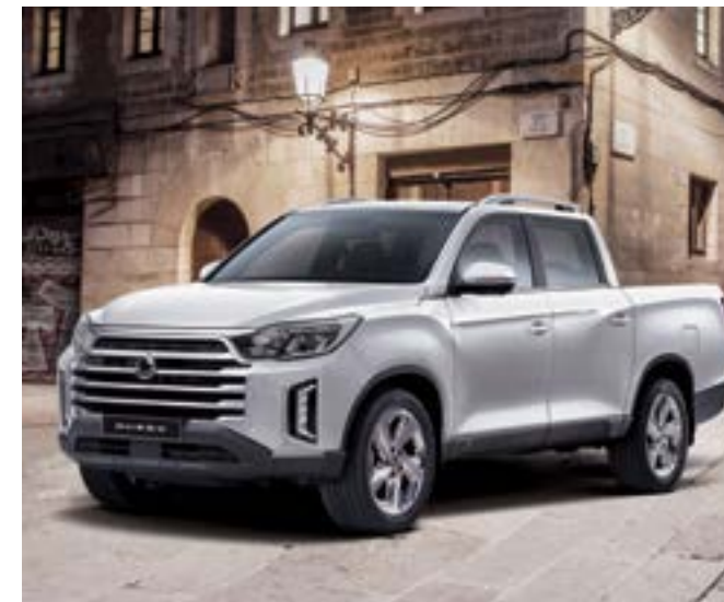
wersja Wild i Adventure Plus z Pakietem Executive