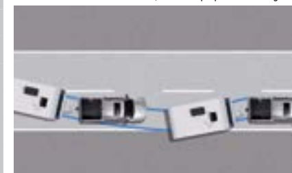
TSC - System kontroli kołysania przyczepy