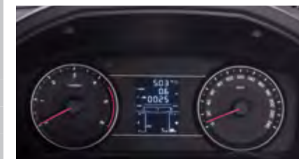
Zestaw wskaźników z 3,5" komp. pokładowym