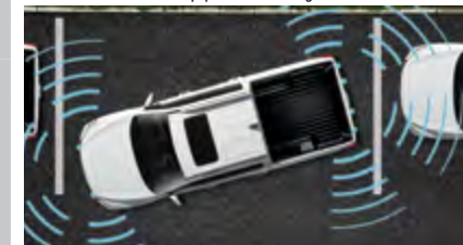
Czujniki parkowania przednie i tylne