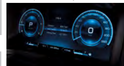
12,3 " cyfrowy zestaw wskaźników