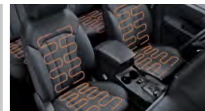
Siedzenia przednie i tylne podgrzewane