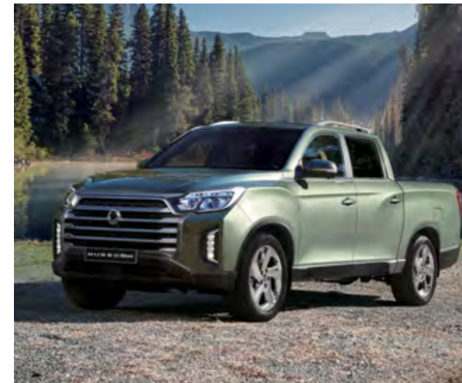
wersja Wild i Adventure Plus z Pakietem Executive