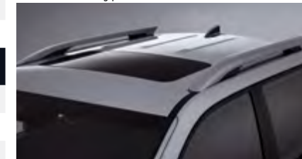
Relingi dachowe i szyberdach