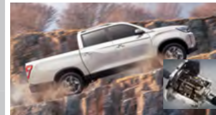
Blokada tylnego mostu (LD)