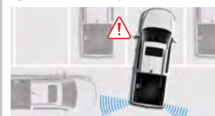
RCTA System monitorowania ruchu za pojazdem z asystentem