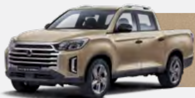
SANDSTONE BEIGE (EBK)