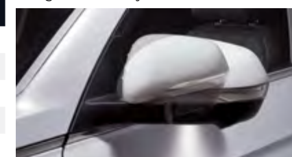
Oświetlenie okolic pojazdu w lusterkach