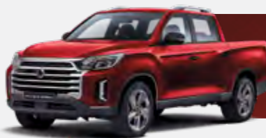
INDIAN RED (RAJ)