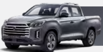
MARBLE GREY (ACM)