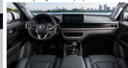
Nowe wnętrze z 12,3 calowym wyświetlaczem Android Auto / Apple CarPlay