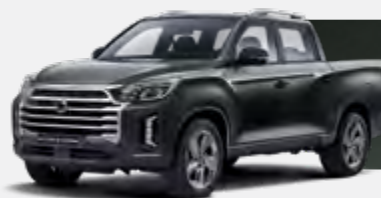
AMAZONIA GREEN (GAM)