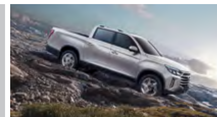
HDC – system kontroli zjazdu ze wzniesienia