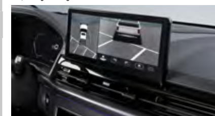
System kamer 360 stopni