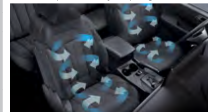
Siedzenia przednie wentylowane