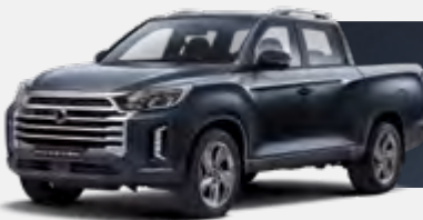
GALAXIES GREY (ADB)