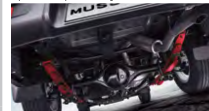
Zawieszenie na resorach piórowych