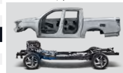
Nadwozie i rama ze stali o bardzo wysokiej wytrzymałości na rozciąganie