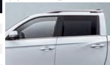
Przyciemniane tylne szyby