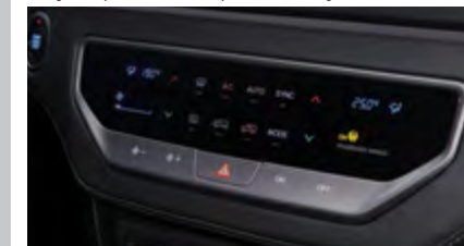
Automatyczna klimatyzacja dwustrefowa