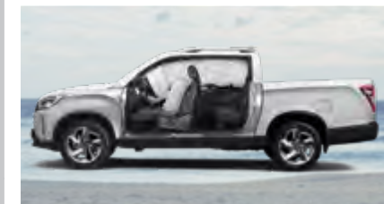
6 poduszek powietrznych