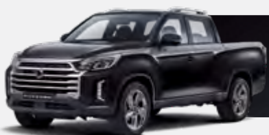
SPACE BLACK (LAK)