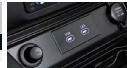
Gniazda USB typu C