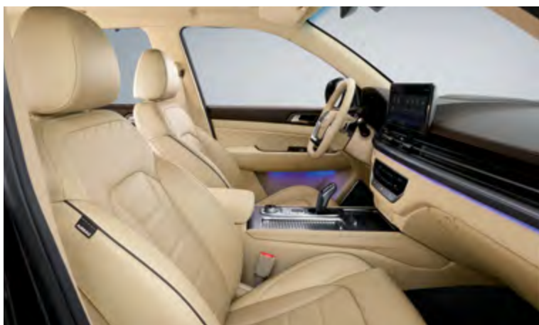
TAPICERKA W KOLORZE BEŻOWYM (EBJ)

Tapicerka skórzana z pikowanym siedziskiem