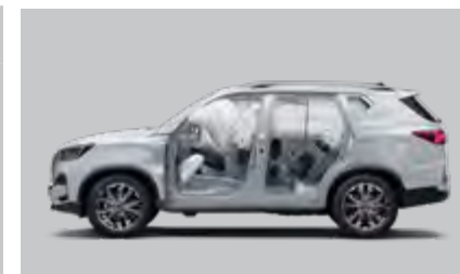
9 poduszek powietrznych