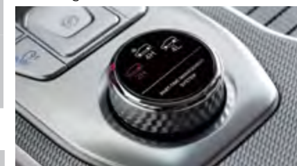
Dołączany napęd na 4 koła