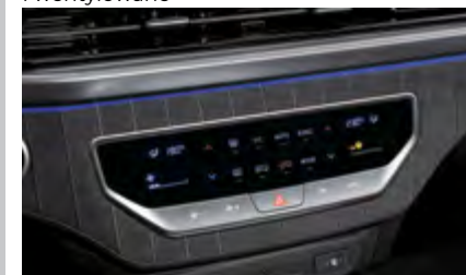
Klimatyzacja automatyczna dwustrefowa