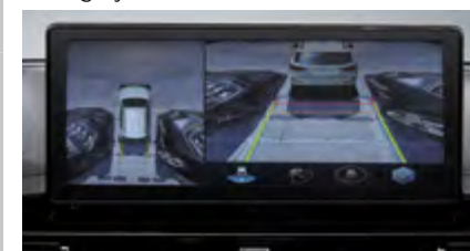
System kamer 360 stopni)