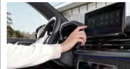
12,3 calowy wyświetlacz systemu Smart Audio i Nawigacji