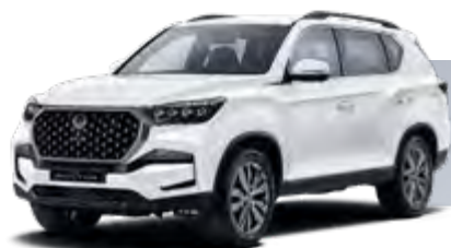
SILKY WHITE PEARL (WAK) PERŁOWY