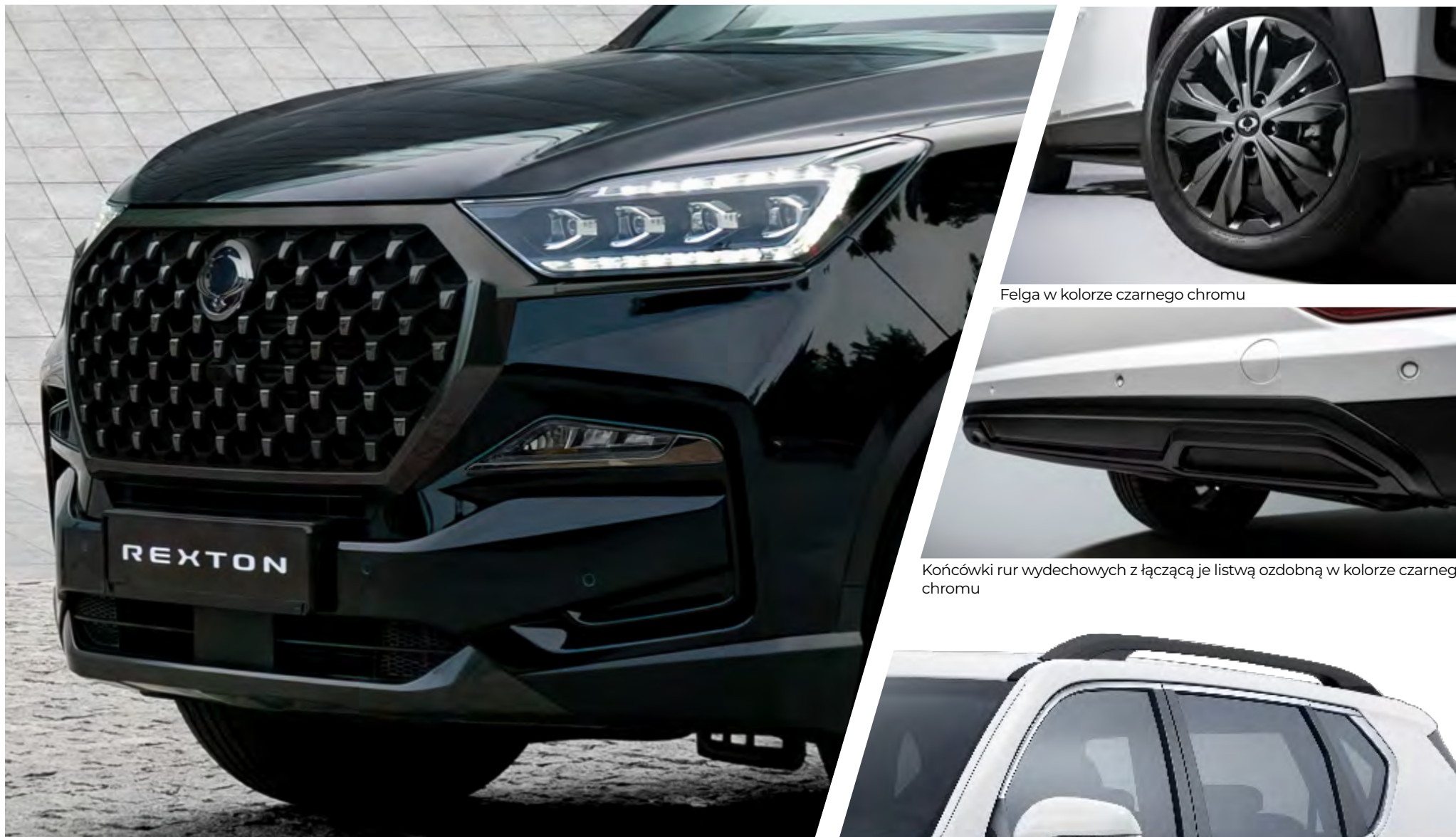
Felga w kolorze czarnego chromu