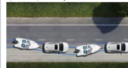
System kontroli kołysania przyczepy (TSC)