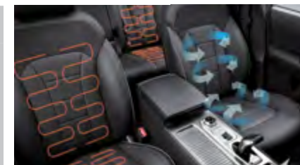
Przednie i tylne siedzenia podgrzewane i wentylowane