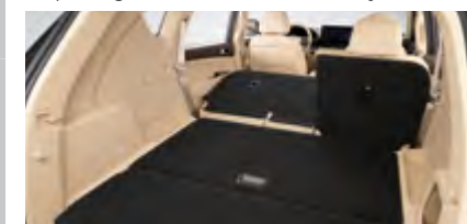
2-rząd siedzeń podwójnie składany w proporcjach 40:60