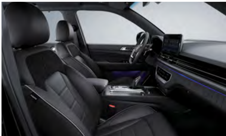
TAPICERKA W KOLORZE CZARNYM (LBN)

Tapicerka skórzana z pikowanym siedziskiem