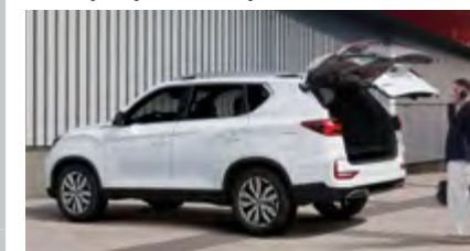
Kłapa bagażnika sterowana elektrycznie