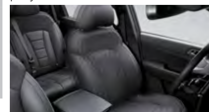
Fotel kierowcy z elektryczną regulacją (8 kierunków) i regulacją podparcia odcinka lędźwiowego (4 kierunki)