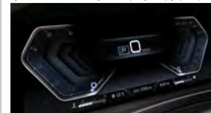
12,3" cyfrowy zestaw wskaźników