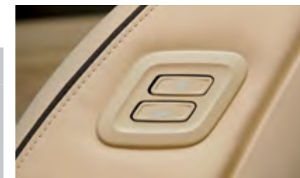
Fotel pasażera z przyciskami sterującymi od strony kierowcy