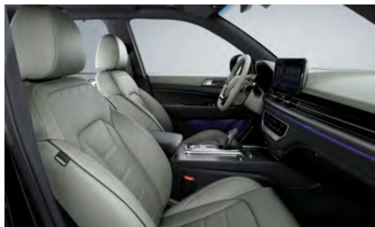
TAPICERKA W KOLORZE KHAKI (E44 / GAN)

Tapicerka skórzana z pikowanym siedziskiem