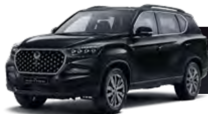
SPACE BLACK (LAK)