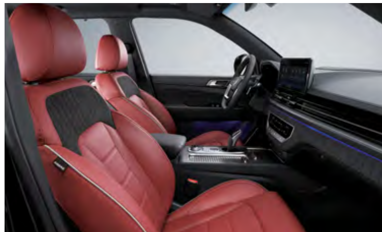
TAPICERKA W KOLORZE BORDOWYM (E50 / OBC)

Tapicerka skórzana ze wstawką z zamszu i pikowanym siedziskiem